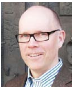
Hans Ek SEB Fonder AB