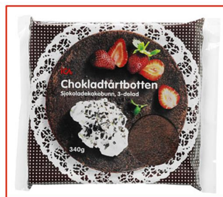
5 % vitt runt objektet